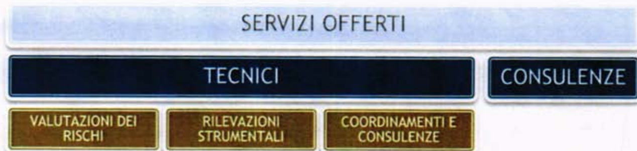
Tabella 1 - aggregazione omogenea dei servizi

Sotto il profilo squisitamente organizzativo, essi possono essere aggregate per natura come riportato nella seguente tabella 1.